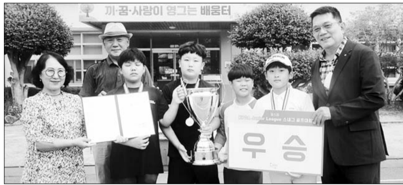
삼산초등학교 골프부가 주축으로 골프팀이 지난 19일 경기도 용인에서 열린 평갈마을 삼산초 스내그

제5회 KPGA Junior League 스내그 골프대회에서 단체전과 개인전에서 우승을 차지했다.