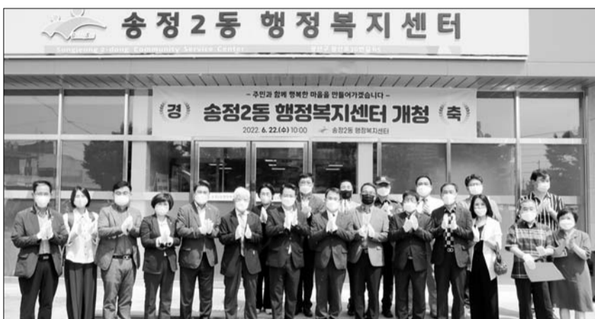
광산구가 22일 송정2동 행정복지센터 신청사 개청식을 개최했다. 송정2동은 1998년 송정3동과 통합된 이후 광산구의회 건물 1층을

임대해 업무를 수행해 왔다. 협소하고 노후한 시설 탓에 주민이 불편을 겪거나 주민자치 프로그램을 운영하는 데도 애로사항이 많아 송정5일시장 인근(광산로30번길 65)에 새롭게 청사를 마련, 이전해 지난 13일부터 업무를 시작했다.