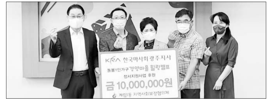
계림동, 한국마사회 광주지사 기부금 전달 동구 계림동 지역사회보장협의체는 22일 한국마사회 광주지사에서 정서적 불안을 겪고 있는 비주택 거주 돌봄 1인 가구의 정서적 지원과 일상 회복을 돕기 위한 기부금 1000만 원을 전달해왔다고 밝혔다.