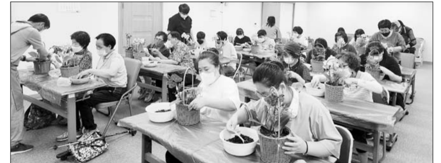
광주시구청장애인복지관, 꽃 생활화 체험교육 프로그램 광주시구청 장애인복지관은 농림축산식품부가 주최하고 한국농수산식품유통 주관, (사) 한국원예치료복지협회 광주광역시지회에서 수행하는 2022년 꽃 생활화 체험교육(원예치료 체험교육)을 진행했다. 이 프로그램은 사회 배려층인 장애인을 대상으로 '호접난 꽃과 함께하는 행복'으로 이란 주제로 미니가든바구니를 만들었으며, 원예치료를 통해 정서 함양 및 심신을 치유할 수 있도록 지원했다. /이달호 기자