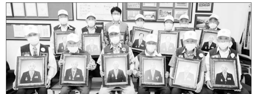
#고맙습니다. 6·25참전 호국영웅에 장수사진 광산구는 22일 6·25전쟁 제72주년을 앞두고 6·25참전유공자회 사무실을 찾아 호국영웅 20명에게 장수사진을 전달했다고 밝혔다. 장수사진은 조국과 민족을 위해 모든 것을 바친 6·25참전 호국영웅의 희생과 헌신에 고마운 마음을 표현하기 위해 마련했다.