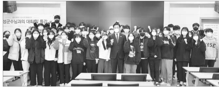
장성군은 이를 위해 '장성군 초·중·고교생 입학축하금 지원조례'를 제정하고, 필요 예산을 확보했다.

교육의 공공성을 강화하고 보편적 교육복지 실현을 위해 초등학생 10만원, 중학생 20만원, 고등학생은 30